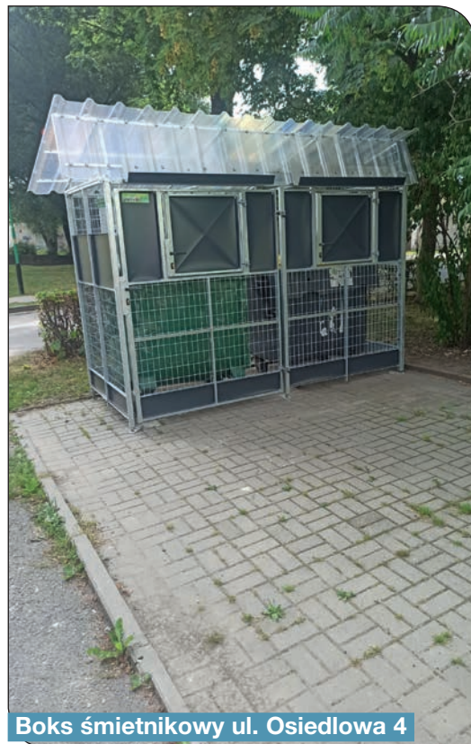
Boks śmietnikowy ul. Osiedlowa 4