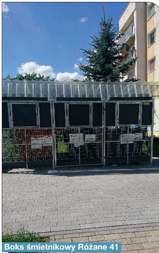
Boks śmietnikowy Różane 41

Redakcja nie odpowiada za treść publikowanych reklam, ogłoszeń i listów. Materiałów, które nie zostały zamówione nie zwracamy. Redakcja zastrzega sobie prawo do zmian w nadesłanych tekstach.