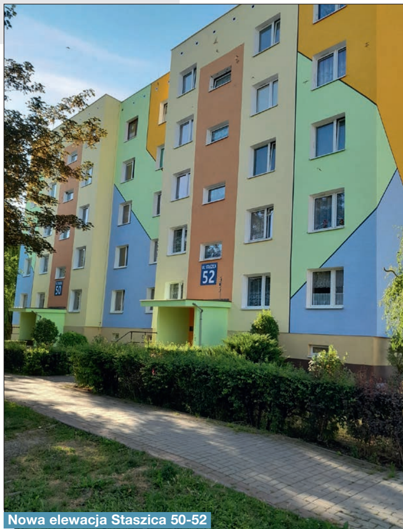
Nowa elewacja Staszica 50-52