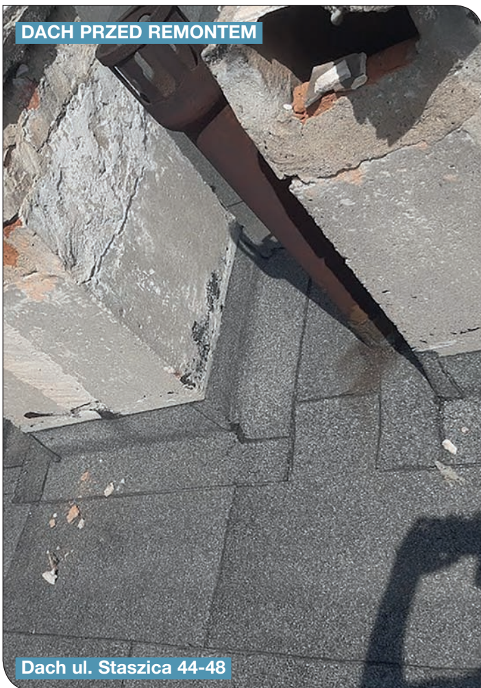
Dach ul. Staszica 44-48