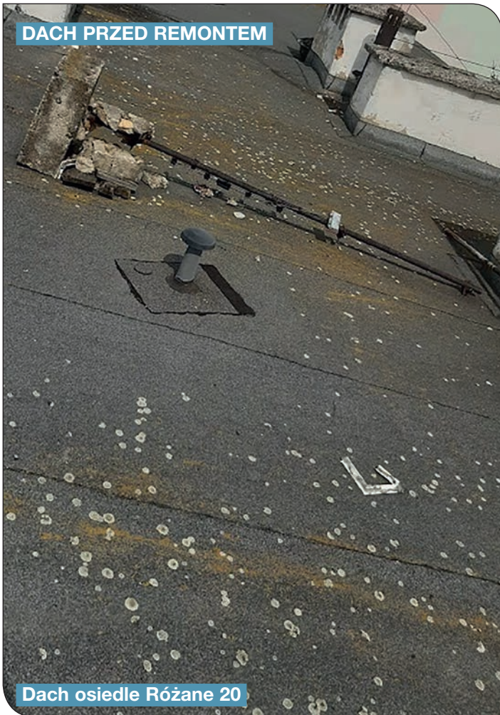
Dach osiedle Różane 20