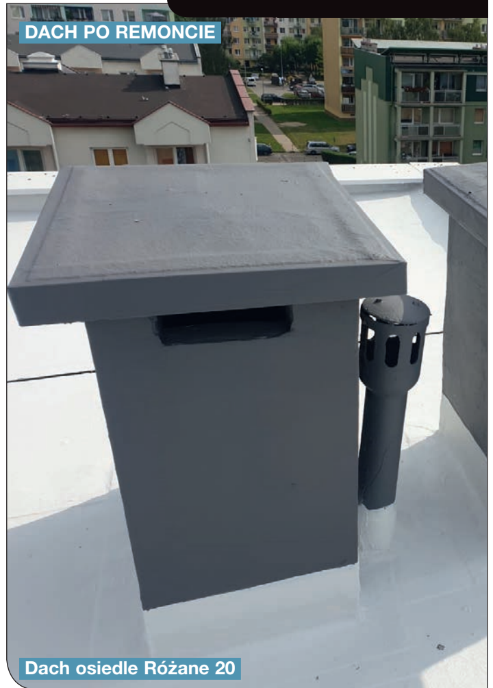
Dach osiedle Różane 20